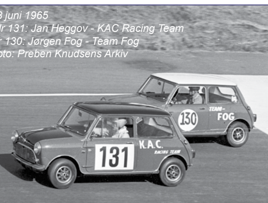
3 juni 1965 nr 131: Jan Heggov - KAC Racing Team nr 130: Jørgen Fog - Team Fog

Formel-karriere og igen afsluttende i standardbil, bl.a. BMW.